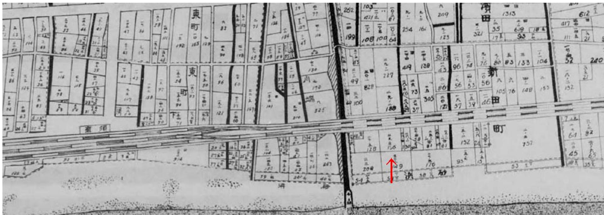
シーサイドハウス千鳥